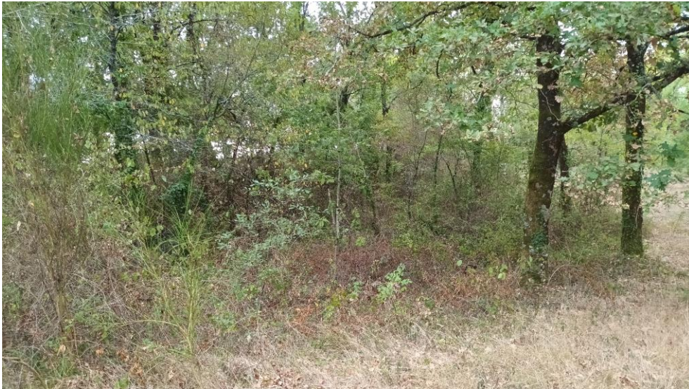
Figure 5 : Fossé au sud-est du site, corridor écologique utilisé par la Cistude, faisant l'objet du débroussaillage en période hivernale

Le fossé faisant le lien entre l'Isle et les mares temporaires sera débroussailler. Néanmoins, afin de ne pas impacter la Cistude d'Europe qui emprunte ce corridor, le gros des opérations devra être effectué en période hivernale, période d'inactivité de la Cistude.