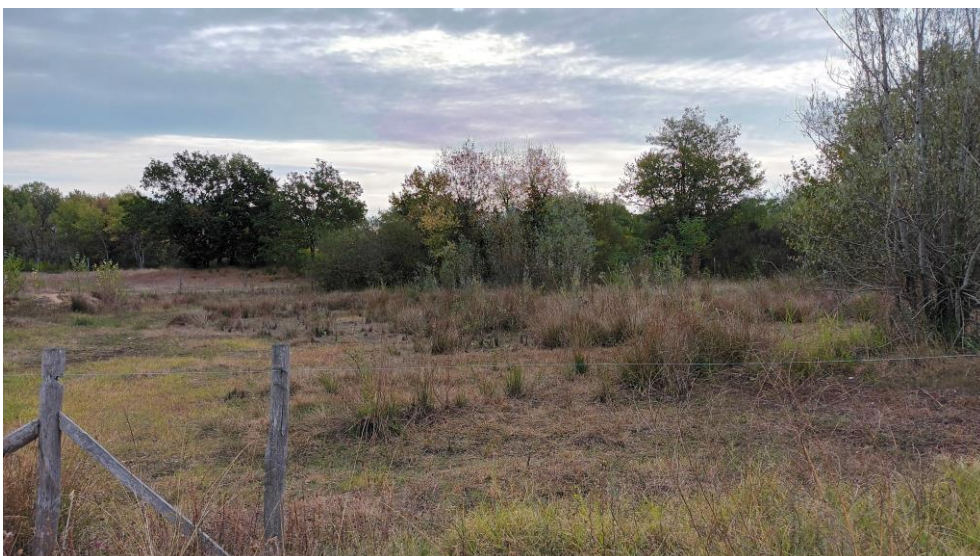
Figure 4 : Une des mares temporaires gérées par le SMBI

Les mares temporaires gérées par le SMBI seront débroussailler biennuellement afin d'éliminer les ronciers et arbustes non souhaités. Ce débroussaillage sera géré par le SMBI.