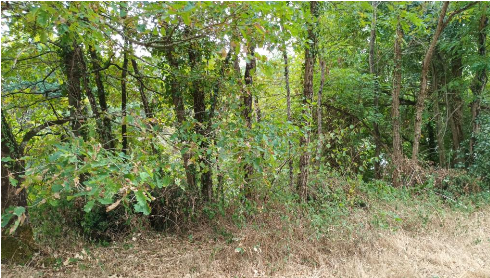
Figure 3 : Ripisylve en zone Natura 2000 exempte de débroussaillage

La portion de site Natura 2000 concernée par l'emprise de 50 m de débroussaillage autour du projet, sera exempte de débroussaillage de part le faible niveau de risque incendie et les forts enjeux environnementaux.